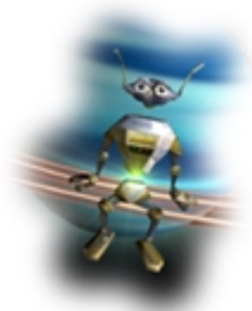
新ゲームを始める