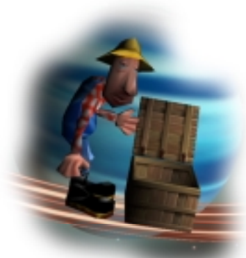
ゲームを再開する