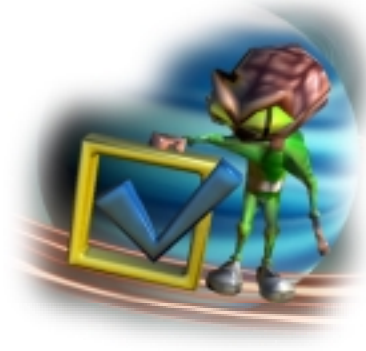
ゲーム設定とコントロール