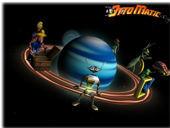
Il menu principale

Utilizzare i tasti freccia sinistra/destra e la barra spaziatrice per selezionare le opzioni del menu principale: