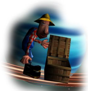
Ripristina partita salvata