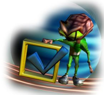
Impostazioni e controlli