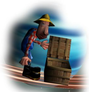
Charger une partie enregistrée