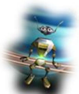
Commencer une nouvelle partie